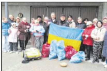
Deutsch-ukrainisches Putzteam.